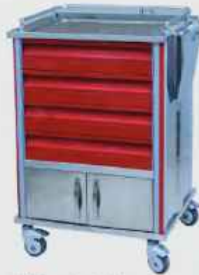
تrolley اورژانس ABS