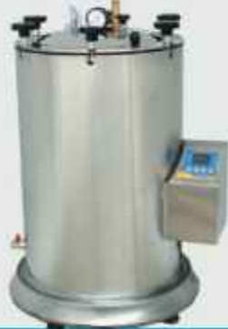
اتوکلاو ۷۵ لیتری