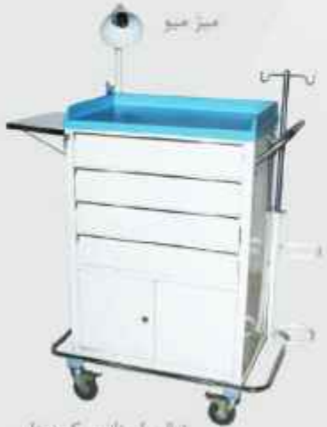
تrolley اورژانس کمند دار